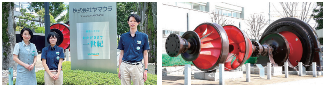
実際に発電所で使用されていた水車のモニュメント