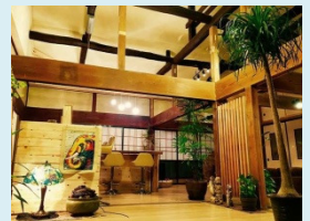
リノベーションした店内

地域の野菜を活用したメニューを提供するとともに、外国人を含めた旅行者への民泊サービスの提供も行っている。